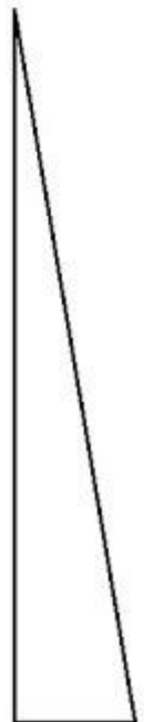
KRÓTSZY I DŁUŻSZY TRÓJKĄT